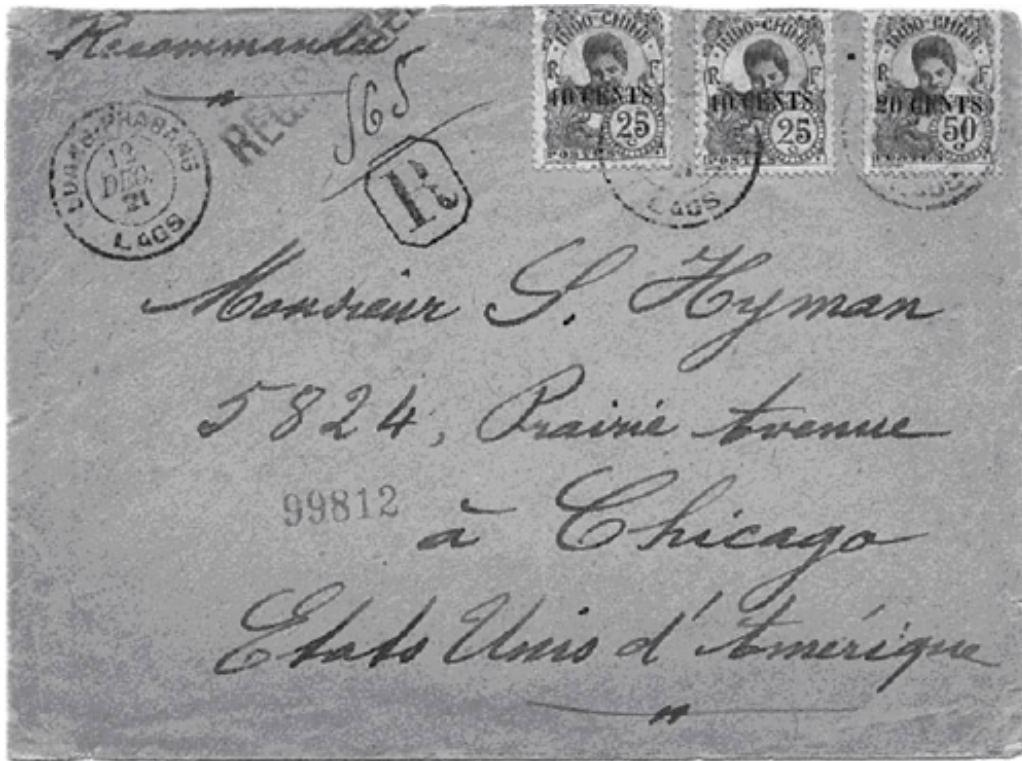
Figure 3. Early Indochinese cover posted from Luang Prabang, Laos.

ໃນໄລຍະທີ່ລາວປະກາດເອກະລາດ (Kingdom of Laos) ນັບແຕ່ປີ 1945-1975 ໃນຊ່ວງຕົ້ນຂອງຊຸມປີ ດັ່ງກ່າວ ດ້ວຍການນຳພາອັນສະຫລາດສ່ອງໃສຂອງສູນກາງພັກ ແລະ ການຊີ້ນຳໂດຍກົງຂອງຄະນະພັກແຄວ້ນລາວ ຂະບວນການປະຕິວັດປົດປ່ອຍຊາດຢູ່ລາວນັບມື້ຂະຫຍາຍຕົວ ແລະ ກ້າວໄປສູ່ຄຸນນະພາບໃໝ່, ພັກເຮົາໄດ້ນຳພາປະ ຊາຊົນລຸກຂຶ້ນຍຶດອຳນາດການປົກຄອງຢູ່ວຽງຈັນ ໃນວັນທີ 23 ສິງຫາ 1945 ແລະ ຕໍ່ຈາກນັ້ນມາກໍໄດ້ຍຶດອຳນາດ ການປົກຄອງຢູ່ຫຼາຍທ້ອງຖິ່ນ, ເປັນຕົ້ນແມ່ນຢູ່ແຂວງສະຫວັນນະເຂດ ເຊິ່ງປະຊາຊົນໄດ້ໂຄ່ນລົ້ມອຳນາດການປົກ ຄອງເກົ່າ ແລ້ວສ້າງຕັ້ງອຳນາດການປົກຄອງປະຕິວັດຂຶ້ນແທນ ໃນວັນທີ 30 ສິງຫາ 1945 ແລະ ໃນທີ່ສຸດ ໃນວັນທີ 12 ຕຸລາ 1945 4 ລັດຖະບານລາວອິດສະຫລະ ເຊິ່ງເປັນສັນຍາລັກແຫ່ງກ່ອນກຳລັງສາມັກຄີທົ່ວປ່ວງຊົນລາວທັງຊາດ ໄດ້ອອກສະເໜີຕໍ່ໜ້າປະຊາຊົນຢູ່ນະຄອນຫລວງວຽງຈັນ; ລັດຖະບານໄດ້ອອກຖະແຫລງການ “ປະກາດເອກະລາດ” ຂອງລາວ, ໃນຖະແຫລງການໄດ້ເວົ້າແຈ້ງກ່ຽວກັບການປ່ຽນແປງອຳນາດການປົກຄອງ, ລຶບລ້າງທຸກສັນຍາທີ່ໄດ້ເຊັນ ກັບພວກລ່າເມືອງຂຶ້ນແບບເກົ່າໃນເມື່ອກ່ອນ, ປະກາດໃຊ້ລັດຖະທຳມະນູນສະບັບຊົ່ວຄາວ, ປະກາດໃຊ້ທຸງຊາດສາມ ສີ, ປະກາດສ້າງຕັ້ງລັດຖະບານປະສົມຊົ່ວຄາວ.