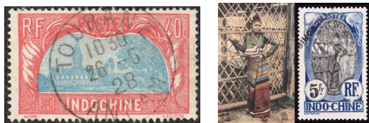
Figure 1 Indochinese Stamps with Laotian Subjects

ໃນໄລຍະການປົກຄອງອິນດູຈີນຝຣັ່ງເສດ (French protectorate of Laos) 2 ນັບແຕ່ປີ 1893-1945 ແຄ່ວນລາວ ກໍໄດ້ຜິມສະແຕມທີ່ມີເອກະລັກຂອງແຄ່ວນລາວອອກມານໍາໃຊ້ ແລະນໍາໃຊ້ຊຸດສະແຕັມໄປສະນີຂອງສາມຊາດອິນໂດຈີນເຂົ້າໃນການໄປສະນີໂທລະເລກ.