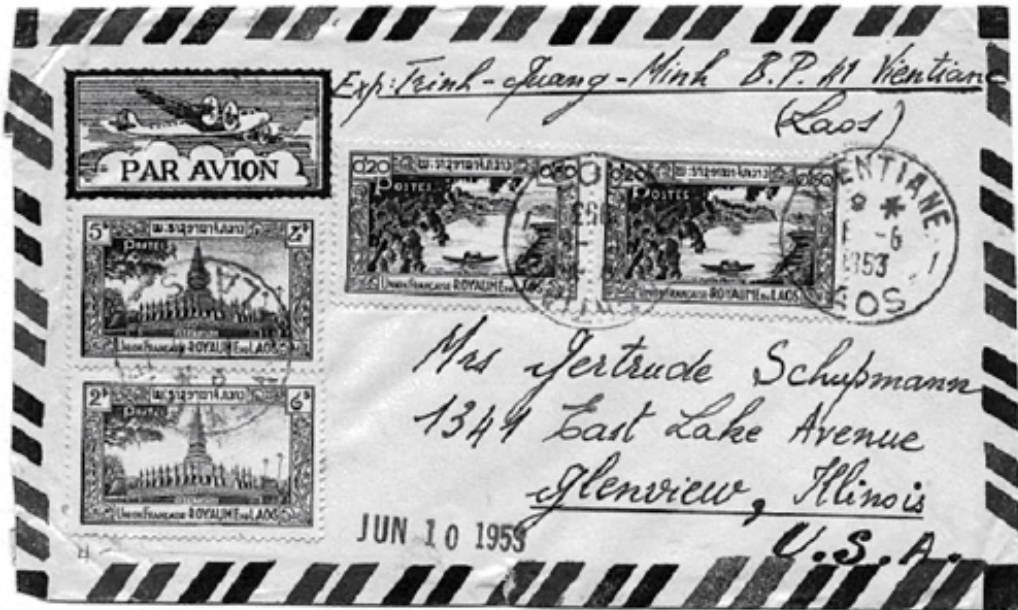
Figure 8. Early cover posted from Vientiane with first issue of Laotian stamps.

ຕໍ່ມາໃນວັນທີ 13 ເມສາ 1952 ໄດ້ມີການອອກໄປສະນີອາກາດ 4 ສະບັບຊຸດທຳອິດ ຊຶ່ງມີຮູບສາວລາວທີ່ຜ້າ ແລະ ວັດຜະແກ້ວ (Figure 10), ນອກນີ້ຍັງໄດ້ອອກສະແຕັມເປັນຊຸດຈຳນວນ 6 ດວງ ຊຶ່ງຮູບພາບ ແລະ ໄປສະນີ ອາກາດຊຸດທຳອິດເຫຼົ່ານີ້ເປັນສະແຕັມທີ່ສວຍງາມທີ່ສຸດ ທີ່ເຄີຍອອກແບບມາໃນປະເທດລາວ ອອກແບບໂດຍ Marc Leguay ສິນລະປິນທີ່ມີພອນສະຫວັນຢ່າງຍິ່ງ ຊຶ່ງຮັບຜິດຊອບໃນການອອກແບບສະແຕັມລາວຈຳນວນຫຼາຍໃນຊ່ວງ ສອງທົດສະວັດຕໍ່ມາ.