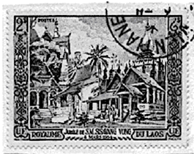
Figure 10. Composite of Laotian temples designed by Marc Leguay.

ຕໍ່ມາໃນວັນທີ 13 ເມສາ 1952 ໄດ້ມີການອອກໄປສະນີອາກາດ 4 ສະບັບຊຸດທຳອິດ ຊຶ່ງມີຮູບສາວລາວທີ່ຜ້າ ແລະ ວັດຜະແກ້ວ (Figure 10), ນອກນີ້ຍັງໄດ້ອອກສະແຕັມເປັນຊຸດຈຳນວນ 6 ດວງ ຊຶ່ງຮູບພາບ ແລະ ໄປສະນີ ອາກາດຊຸດທຳອິດເຫຼົ່ານີ້ເປັນສະແຕັມທີ່ສວຍງາມທີ່ສຸດ ທີ່ເຄີຍອອກແບບມາໃນປະເທດລາວ ອອກແບບໂດຍ Marc Leguay ສິນລະປິນທີ່ມີພອນສະຫວັນຢ່າງຍິ່ງ ຊຶ່ງຮັບຜິດຊອບໃນການອອກແບບສະແຕັມລາວຈຳນວນຫຼາຍໃນຊ່ວງ ສອງທົດສະວັດຕໍ່ມາ.