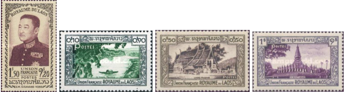
ຮູບສະແຕັມຂອງລາວທີ່ຜະລິດອອກຊຸດທໍາອິດໃນປີ 1951

ສະເພາະປະເທດລາວໄດ້ນໍາໃຊ້ສະແຕັມຂອງອິນໂດຈີນຝຣັ່ງເສດມາຈີນຮອດທ້າຍປີ 1951 ຈາກນັ້ນລາສຊະ ອານາຈັກລາວຈຶ່ງໄດ້ອອກສະແຕັມຊຸດທໍາອິດເປັນຂອງຕົນເອງ ເມື່ອວັນທີ 13 ພະຈິກ 1951 (kingdom of Laos) 4 ຊຶ່ງເປັນຊຸດທີ່ລາວໄດ້ປະກາດເອກະລາດຈາກຝຣັ່ງ ແລະສະຫຍາມ.