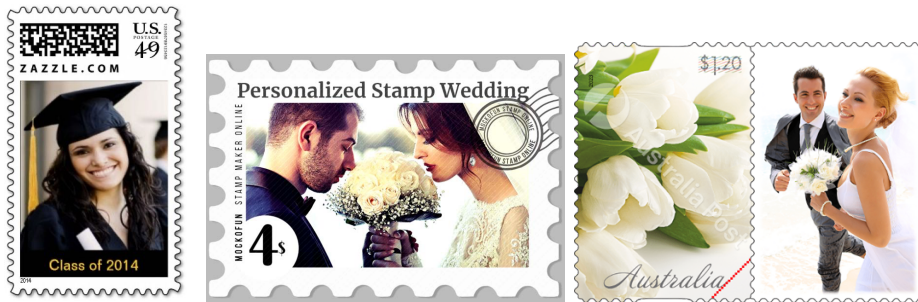
ຮູບສະແຕັມສ່ວນບຸກຄົນ