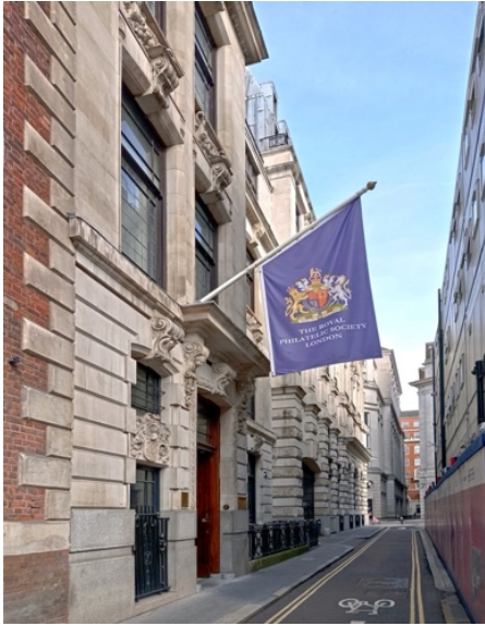
ຮູບ Royal Philatelic Society of London