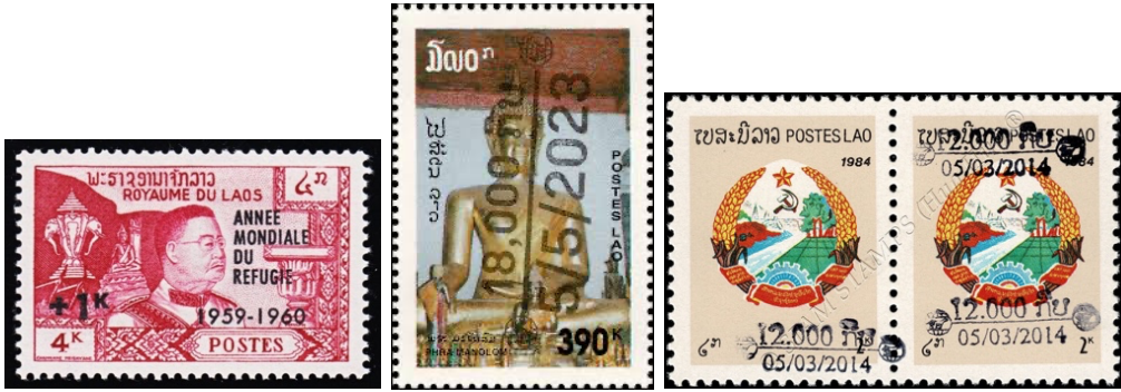
ຮູບສະແຕັມທີ່ດັດແກ້ມູນຄ່າໃໝ່

ສະແຕັມພິມແກ້ທີ່ໃຊ້ເປັນສະແຕັມທົ່ວໄປ ອາດມີຈຸດປະສົງໃນການຈັດພິມຕ່າງໆ ທີ່ແຕກຕ່າງກັນ ນຳສະແຕັມຂອງປະເທດໜຶ່ງພິມຂໍ້ຄວາມ ເພື່ອນຳໄປໃຊ້ໃນດິນແດນອານານິຄົມ ແລະນຳສະແຕັມລາຄາໜຶ່ງມາແກ້ໄຂເປັນອີກລາຄາໜຶ່ງ ເອີ້ນວ່າ ພິມແກ້ລາຄາ (Surcharge) ໃຊ້ກໍລະນີທີ່ໄປສະນີຂາດແຄນສະແຕັມບາງລາຄາ ຫຼືມີການປັບປ່ຽນໜ່ວຍເງິນຕາ ແລະໃຊ້ງານລະຫວ່າງທີ່ລໍສະແຕັມລາຄາທີ່ຂາດແຄນພິມສຳເລັດ ສະແຕັມພິມແກ້ພົບຫຼາຍໃນສະແຕັມຊຸດທຳອິດ ເນື່ອງຈາກການພິມ ແລະການຂົນສົ່ງໃຊ້ເວລາດົນ